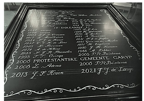
Het namenbord in de Petrustsjerke is bijgewerkt.

Ik geloof dan mijn Verlosser door de dood is heengegaan en op Pasen -God zij glorie- uit het graf is opgestaan. Door het brood – dit is mijn lichaam - door de wijn – dit is mijn bloed - geeft de Vrededorst mij vrede, maakt Hij alle dingen goed. (Evangelische Bundel 289:3)