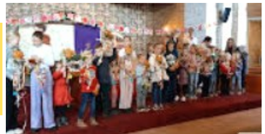
De kinderen met hun zelf-gemaakte Palm-pasentakken op Palmzondag

Vergeet u niet om het 40-dagen project te steunen? Geld kan gestort worden bij de Spar, bij school, in de brievenbus bij de kerk, in de kerk en natuurlijk ook door een bedrag over te maken naar de rekening van de diaconie NL 12RABO 0362777705 met vermelding gift 40-dagen project 2023.