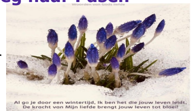
Al go je door een wintertijd, ik ben het die jouw leven leidt. De kracht van Mijn liefde brengt jouw leven tot bloei!